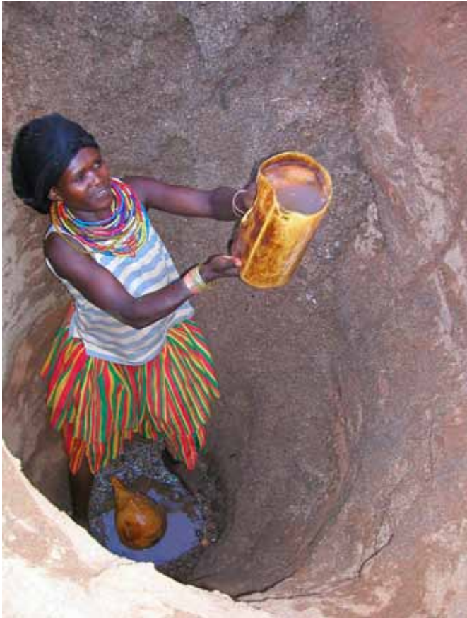
Viða er vatnsskortur mikill