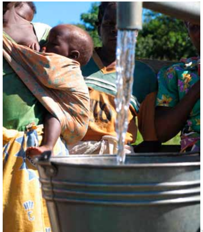
Vatn er líf