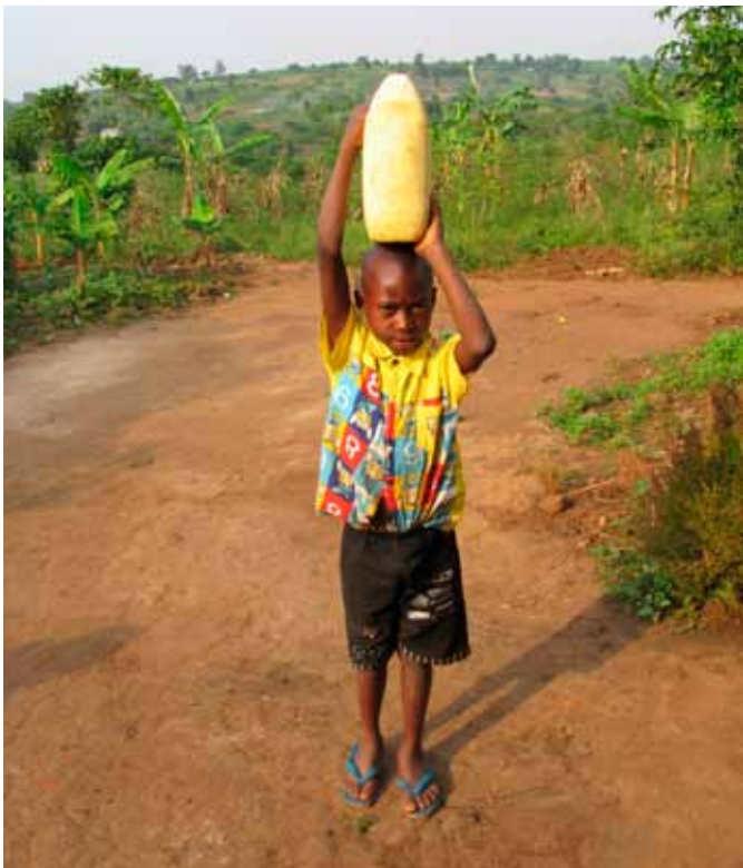
Drengur í Úganda sækir vatn

Við brunninn sjáum við að Jesús er mennskur, hann er maður, hann þyrstir eins og alla aðra menn, enda gat hann ekki tekið á sig synd mannsins öðruvísi en að vera maður, hann sagði meira að segja á krossinum þessi orð: mig þyrstir. Með fórnardauða á krossi og upprisu varð hann sjálfur hið lifandi vatn. Hann viðurkennir samversku konuna ekki bara hér á jörð heldur til eilífs lífs, með því að taka á sig syndir hennar og veita fyrirgefningu, henni og öllum mönnum. Þetta lifandi vatn getur aðeins Jesús gefið, gætum þess að taka aldrei hið lifandi vatn, Jesúm sjálfan og fórnardauða hans og upprisu, út úr kristindóminum – þá er ekkert sem skilur kristindóminn frá flestum öðrum trúarbrögðum. Þá erum við farin að velja að drekka óhreina vatnið, sem hefur svo margar aukaverkanir og leiðir til óheilbrigðis. Þegar við rækjum ekki samfélagið við frelsara okkar er það eins og að drekka ekki nóg vatn en það kom oft fyrir mig þegar ég var að störfum í Eþíópíu, og því fylgdi gjarnan höfuðverkur, óskýr hugsun; kraftur og geta minnkaði og heilsunni gat hrakað hratt vegna vatnsskorts.